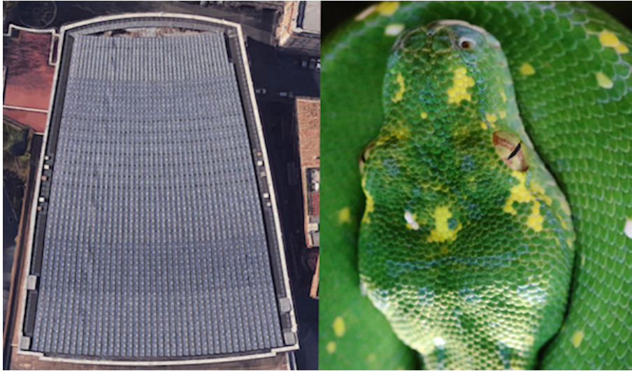
Wanneer je het gebouw binnenkomt, is het alsof je letterlijk in de bek van een slang kijkt.