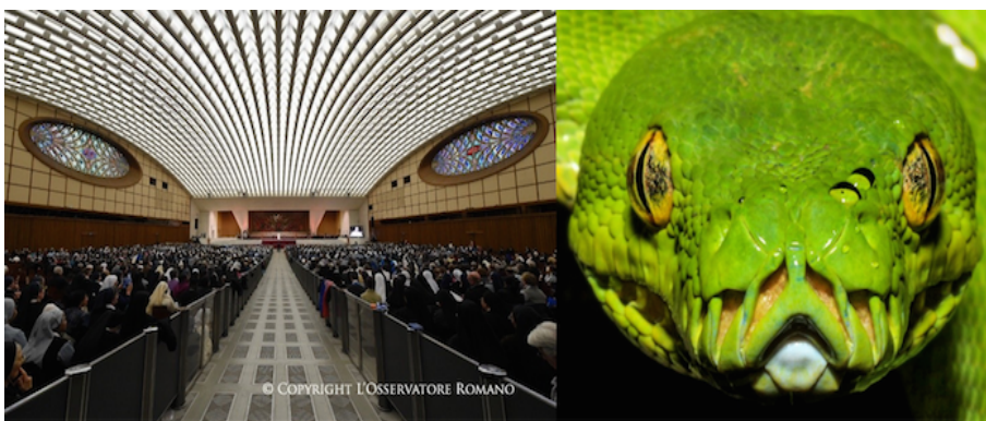
En in dit gebouw werd op 8 januari een voorstelling gegeven door artiesten die op Natural News werd vergeleken met een drag queen circus.